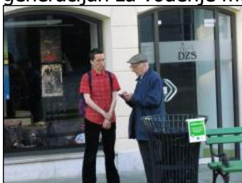
Srečanje generacij

In končno, ali res razumemo druge generacije ali razumemo zgolj svojo? Imamo dovolj znanja o generacijah za vodenje medgeneracijskih praks ali preprosto za boljše skupno življenje?